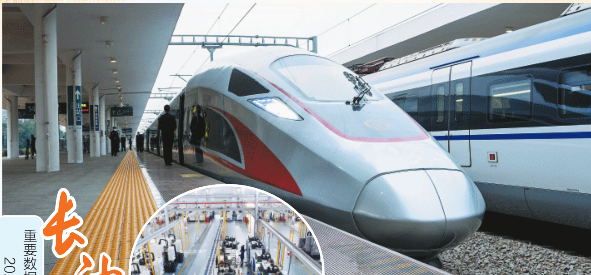
↑2022年12月26日,渝厦高铁常益段全线贯通,进一步促进长株潭城市群与湘西北产业带融合发展。