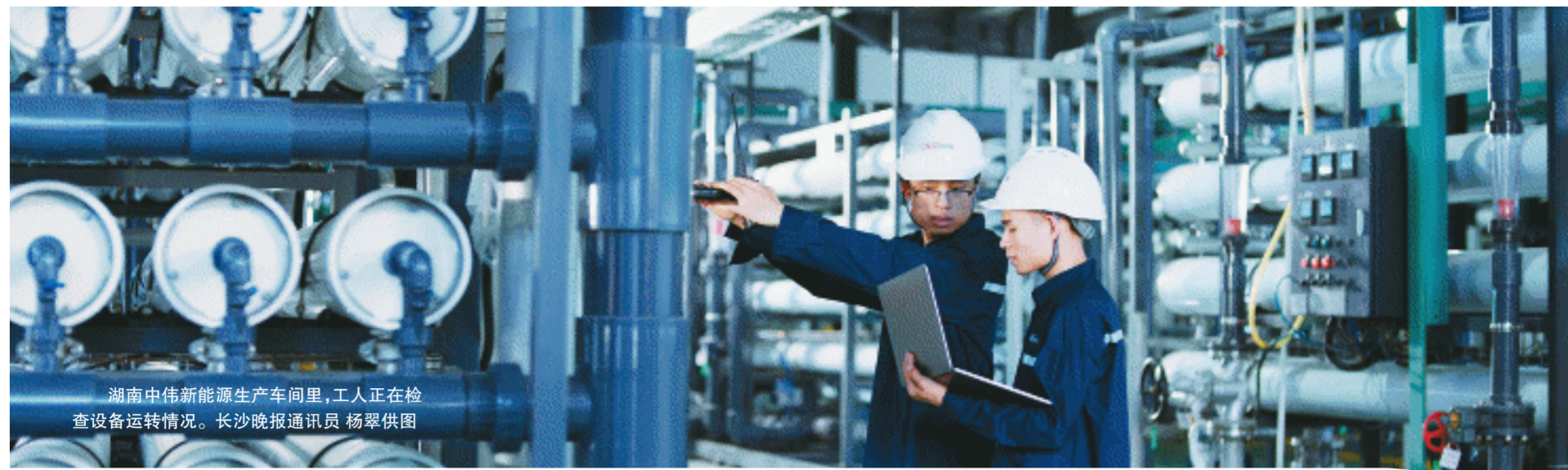
湖南中伟新能源生产车间里，工人正在检查设备运转情况。