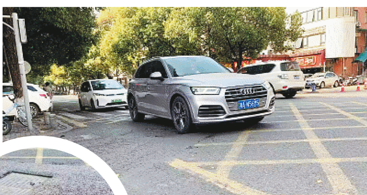
车辆碾过,一些窨井盖会发出很大的响声。

“白天还好,但是到了晚上夜深人静的时候,这种‘哐当哐当’的声响就显得格外刺耳。特别是到了晚上10时以后,车速比白天更快,小区里很安静,每次正当我快要睡着的时候,突然楼下就传来‘哐当’的声响一下子就把我惊醒