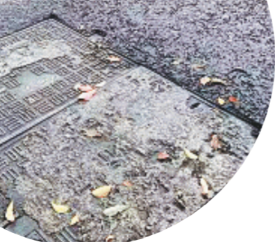
有些窨井盖已经出现了明显的下沉。

阎先生查看现场后说,该处由岳麓区市政维护中心负责的窨井盖都是好的,一旦出现松动,工作人员就会在四周用沥青加固。“现场出现松动的窨井盖主要有9个,分属电力、路灯、住建等部门维