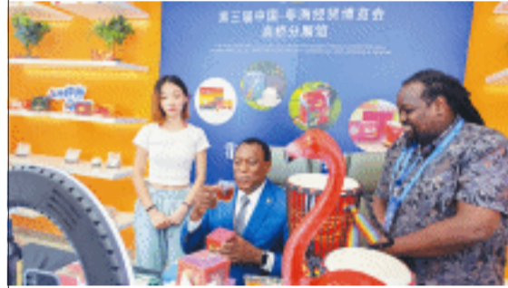
南非驻华大使谢文文在直播间推荐家乡好物博士茶。

长沙晚报6月28日讯(全媒体记者 周游)香醇甘甜的南非白葡萄酒、风味独到的埃塞俄比亚咖啡、鼓声激越的几内亚非洲鼓……市民只需动动手指，数百款精选非洲特色产品就可“一键直达”。28日下午，由商务局、雨花区政府主办的2023年第三届中国-非洲经贸博览会非洲好物网购节在湖南自贸试验区长沙片区雨花区启幕，之后将开展电商直播系列活动，陆续举行百余场直播促销。