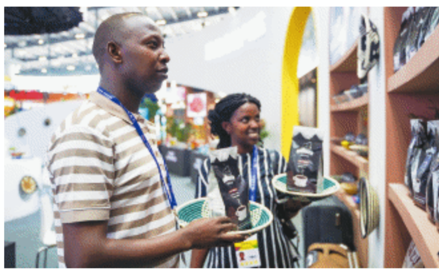
卢旺达展厅内，工作人员在布置展品。