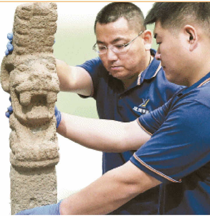
6月28日上午，“美洲豹的传人——墨西哥古代文明展”文物在湖南博物院开箱，图为文物玉米与美洲豹石雕。

“美洲豹的传人——墨西哥古代文明展”将于7月1日在湘博一楼特展二厅正式展出，展至9月17日，为收费展览。