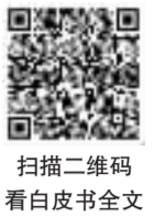
扫描二维码 看白皮书全文

白皮书共约2.2万字，除前言、结束语外分为五个部分，分别是：人类站在历史的十字路口；解答时代之问，描绘未来愿景；扎根深厚历史文化土壤；既有目标方向，也有实现路径；中国既是倡导者也是行动派。