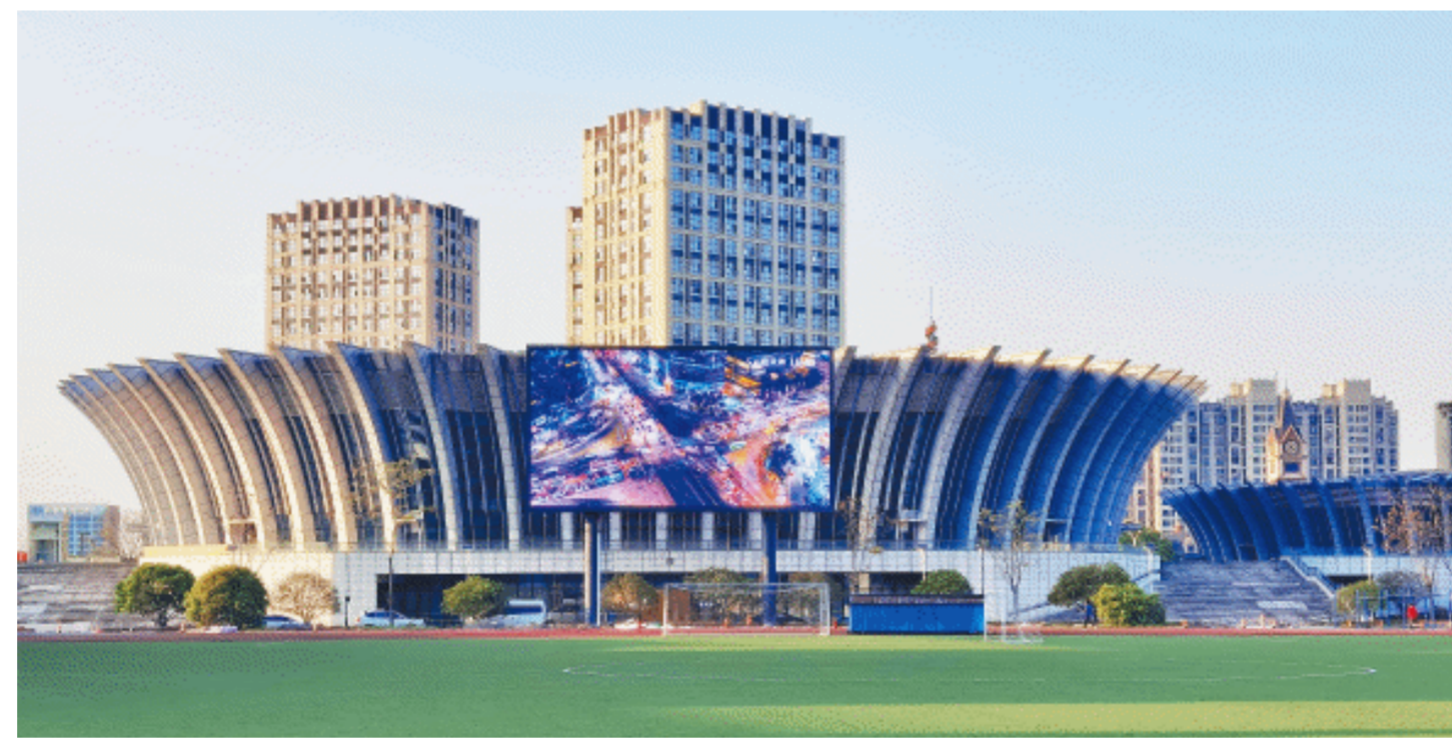
杭州亚运会浙江工商大学手球馆安装了利亚德显示屏。

这些显示设备，均来自利亚德。据了解，杭州亚运会、亚残运会比赛分布在56个竞赛场馆