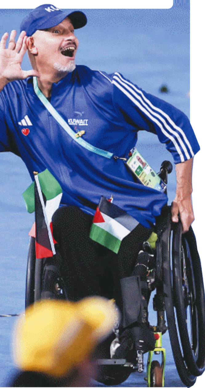
科威特代表团成员在开幕式上入场。

随着嘹亮的国歌声响起,五星红旗冉冉升起,场地中的手语老师带着残疾人演员深情地用手语与大家合唱国歌,同心共唱爱国深情。