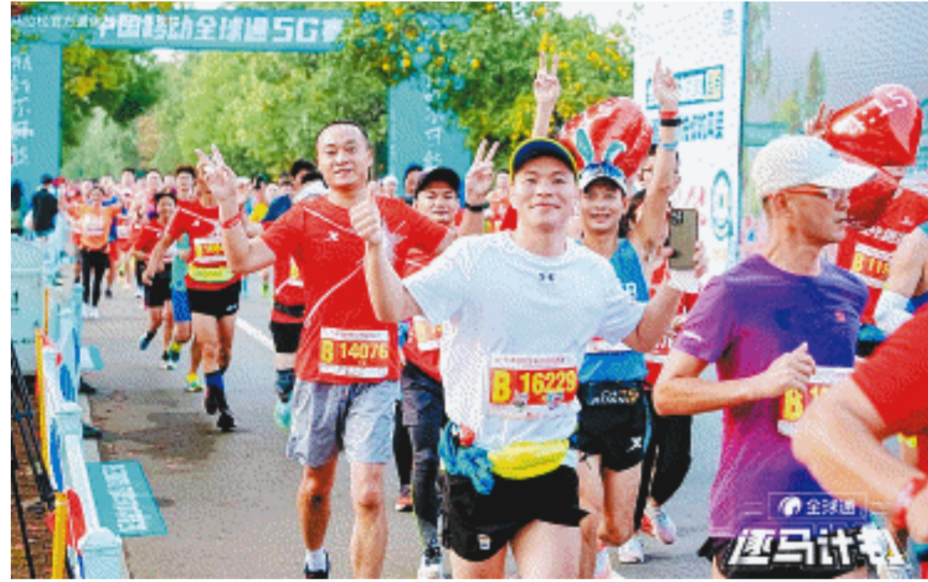
湖南移动在橘子洲路段打造出一公里5G加速赛道，吸引了众多参赛者竞相打卡。