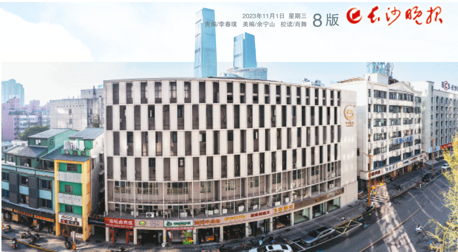
中金珠宝电子商务(长沙)有限公司正式落户芙蓉区中国黄金街。

“预计2023年双十一期间，即可实现销售额过10亿元。未来，我们将继续全力推动中国黄金品牌电商业务发展，以市场为导向，优化产业链，联动线上线下，完善运营生态，全力打造中国黄金直播基地，布局中国黄金线上矩阵。”该负责人表示，将充分发挥“央地合作”的政策优势，推动长沙黄金珠宝产业链发展，立足湖南，深度辐射全国市场，畅通循环发展渠道，打造全产业链云平台。