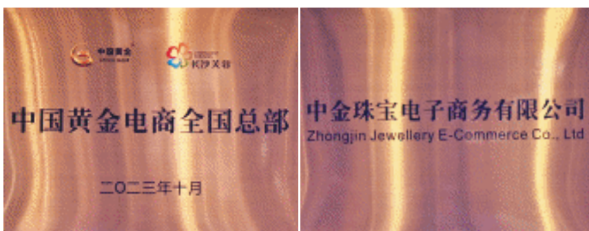
中国黄金电商全国总部揭牌，中国黄金街再结“金果”。