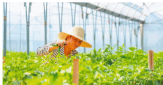
村民在采摘秋辣椒。