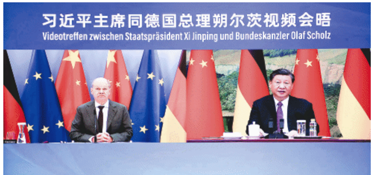
习近平主席同德国总理朔尔茨视频会晤 Videotreffen zwischen Staatspräsident Xi Jinping und Bundeskanzler Olaf Scholz