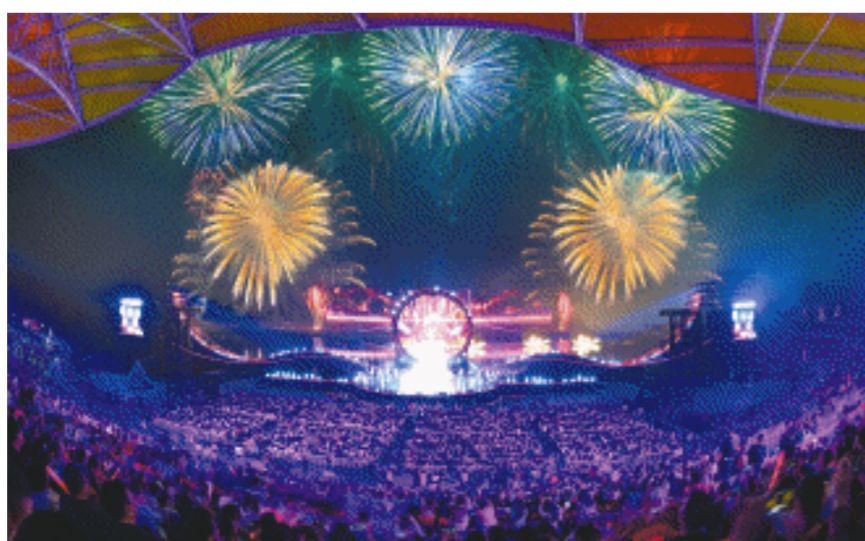
11月3日晚，一场精彩的烟花秀在浏阳天空剧院上演，绚丽的创意烟花犹如一封封写给星空的情书。

整场烟花艺术汇演以“满城烟花等你来”为主题，由《近悦远来》《我心已来》《爱达未来》三个篇章构成，融合了歌舞、器乐演奏、“行进式数字焰火秀”、原创音舞诗画、杂技、多媒体情景舞蹈剧、水陆空烟花科技秀等节目形式，巧妙运用空