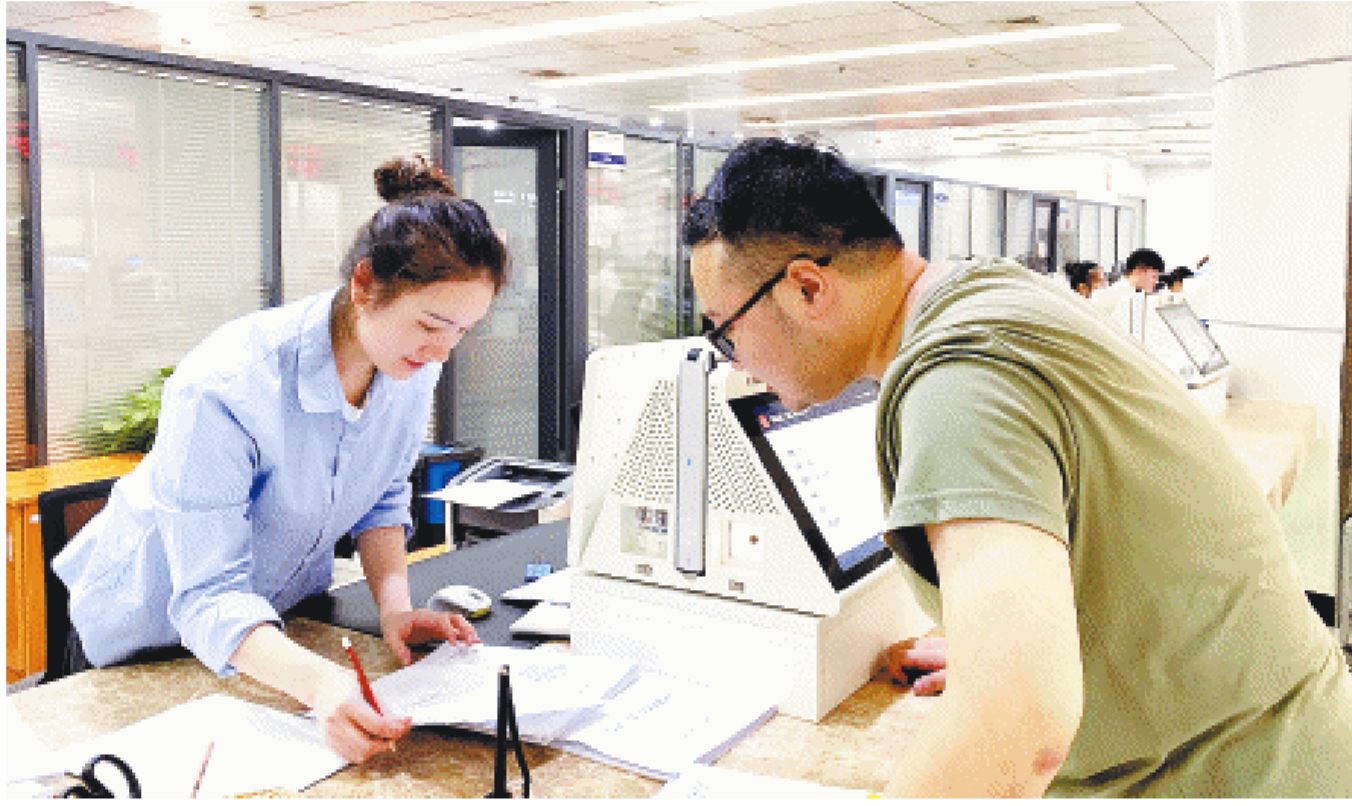
湖南湘江新区“个转企”服务专窗,市民正在办证。

“今年新区共有近百家企业完成了‘个转企’登记。”湘江新区行政审批服务局相关负责人表示,这项新的改革对于经营多年的个体户变更、转型十分便利,有利于个体工商户的持续经营,打造更多“十年老店”“百年老字号”。