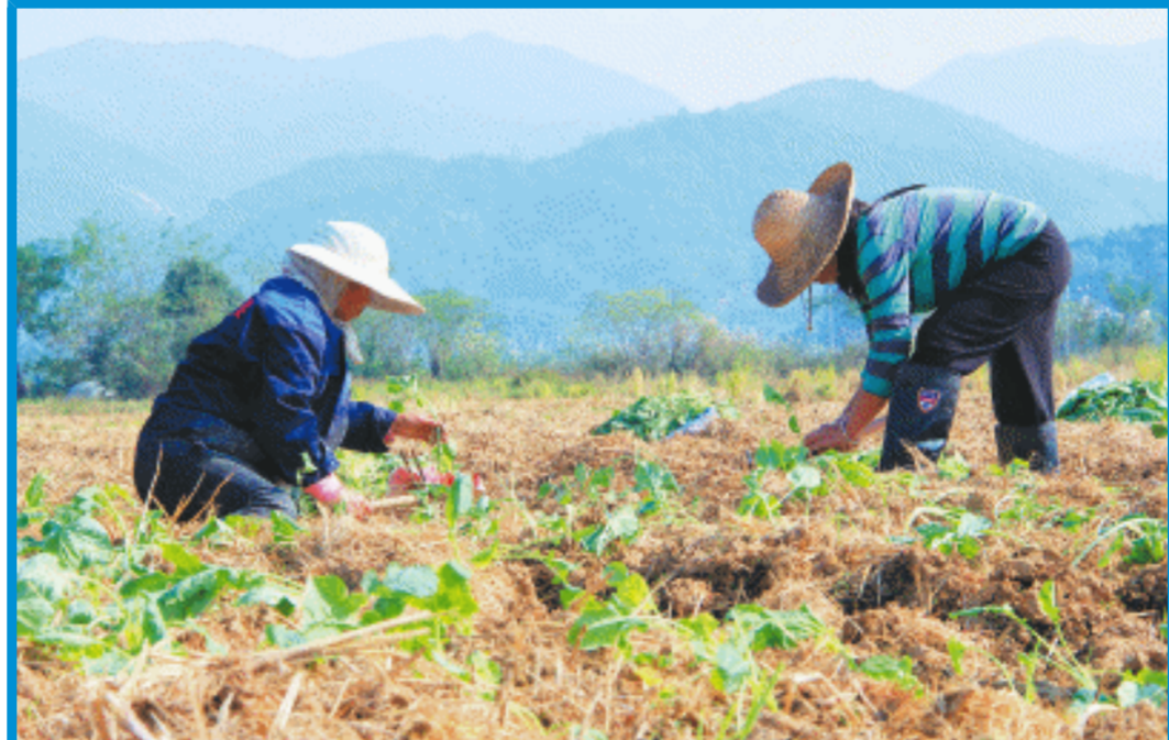
3000余亩移栽的油菜,主要分布在茶亭水库和惜字塔周边,届时将成为当地一道夺目的风景。

雨花区行政审批局局党组书记熊灿介绍,截至目前,全区共配备专(兼)职网格员1768名;“将政务热线工作纳入基层网格治理体系是雨花区办理民生实事的创新举措,通过发挥网格的作用,可以让群众的困难‘小事不出网格,大事不出社区’,从机制理顺真正做到一呼即应、未诉先办。”