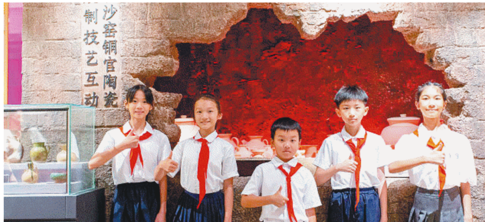
非遗馆着力“非遗从娃娃抓起”，开展活动提升少儿体验感。