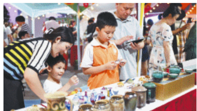
6月9日晚,由长沙市非物质文化遗产保护中心(长沙非遗馆)等承办的长沙市2023年文化和自然遗产日宣传展示系列活动启幕,文旅集市点亮长沙夜生活。(资料图片)

当5年前的11月7日,长沙市非物质文化遗产保护中心(长沙非遗馆)在橘子洲头125号揭开神秘面纱,从此,这座以“家”为主题的场馆,便始终热度不减。五年来,长沙非遗馆组织乐玩非遗公益传习活动1800余场、非遗惠民演出1000余场,线上线下吸引中外游客500余万人次参观。长沙非遗馆已成为闪亮的城市文化名片,成为链接传统文化与市民游客的会客厅,成为非遗传承人的精神家园。