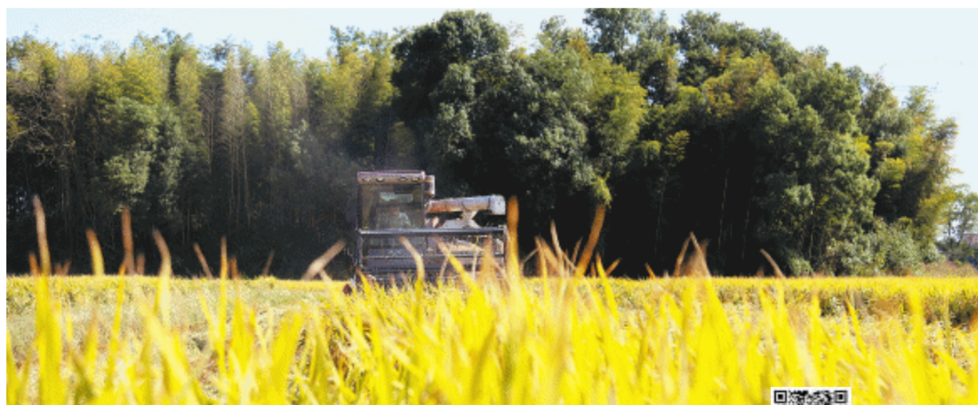
在浏阳市沙市镇，农民正在驾驶农机收割水稻。