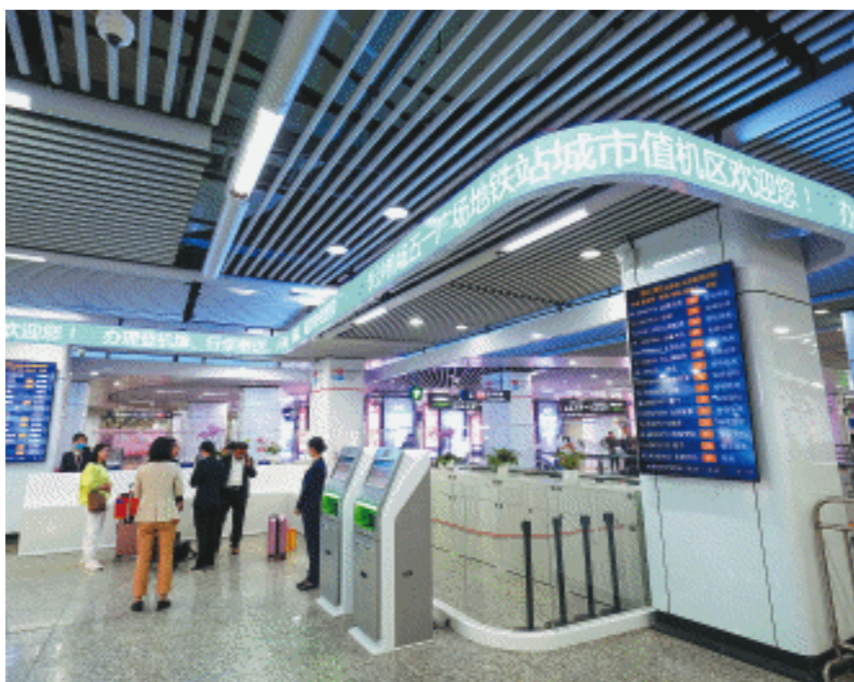
11月10日，长沙五一广场地铁站，长沙机场城市值机区已完成场地建设和设备安装，进入实测阶段。

长沙机场诚挚邀请参与实测的旅客朋友们提出宝贵的意见和建议，一经采纳将送上精美礼品一份表示感谢。