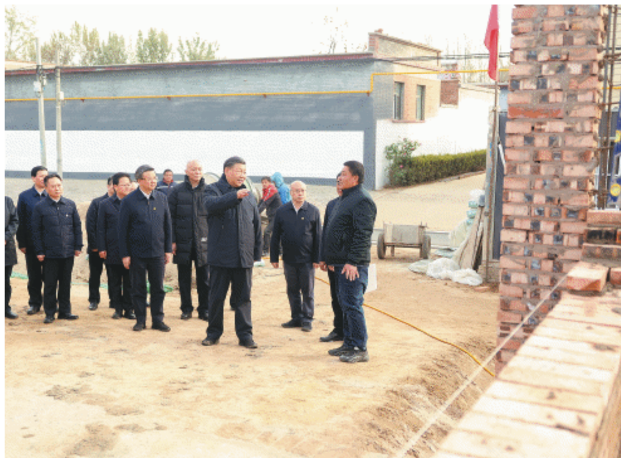
11月10日，中共中央总书记、国家主席、中央军委主席习近平在北京、河北考察灾后恢复重建工作。这是10日下午，习近平在河北保定涿州市刁窝镇万全庄村房屋重建施工现场考察。

●要坚持以人民为中心，着眼长远、科学规划，把恢复重建与推动高质量发展、推进韧性城市建设、推进乡村振兴、推进生态文明建设等紧密结合起来，有针对性地采取措施，全面提升防灾减灾救灾能力。