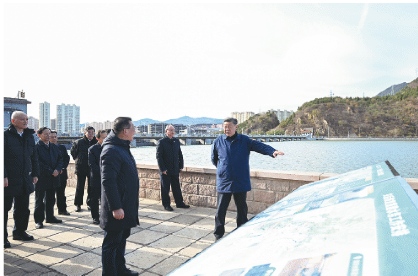
11月10日，中共中央总书记、国家主席、中央军委主席习近平在北京、河北考察灾后恢复重建工作。这是10日上午，习近平在北京门头沟永定河三家店引水枢纽考察。