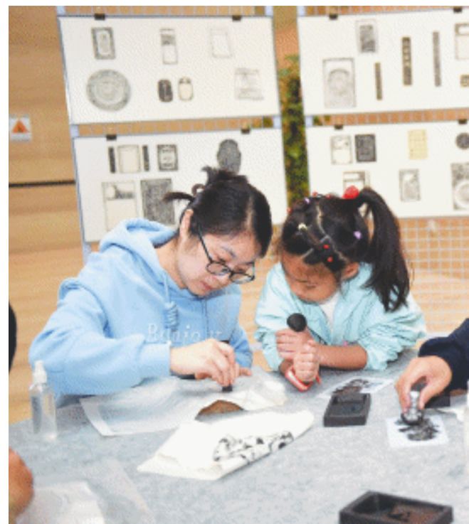
市民正在参与体验拓印活动。