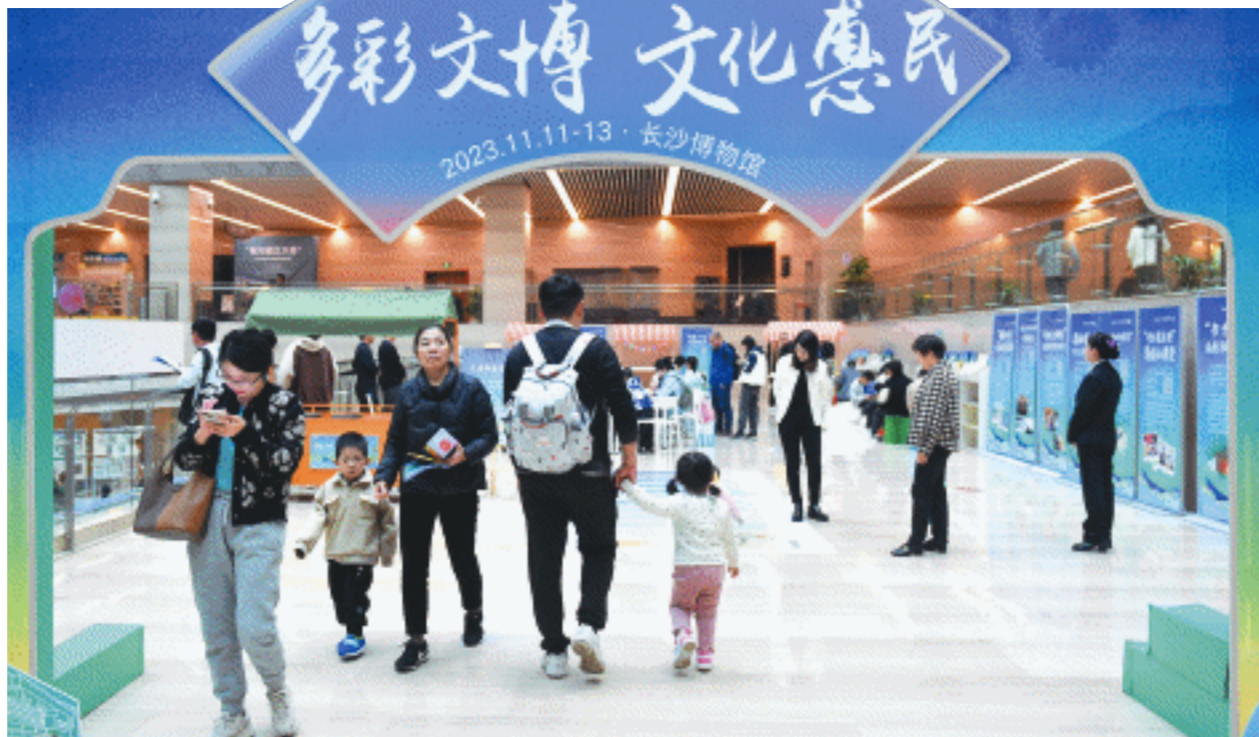
11月11日,长株潭区域博物馆联盟教育展示与交流活动在长沙博物馆举行。