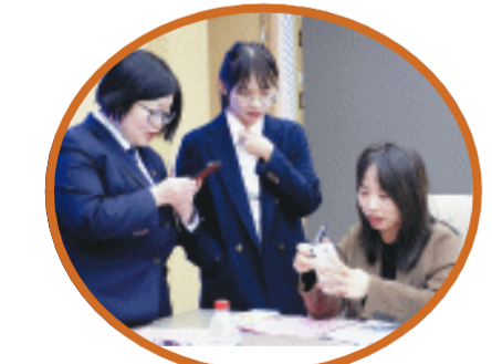
银行工作人员与企业负责人进行交流。

本次活动由长沙市工业和信息化局、长沙投资控股集团有限公司和长沙晚报社指导,长沙市企业服务中心、长沙市开福区企业发展促进中心主办,长沙市开福区中小微企业服务中心、长沙市开福区金霞经济开发区商会和医械好融通信用管理(湖南)有限公司承办。