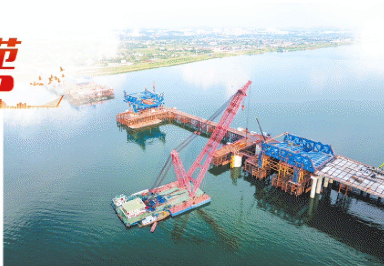
暮坪湘江特大桥推广使用了一批新技术、新材料、新工艺、新设备,实现绿色智能建造。