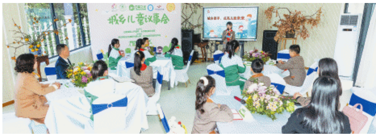
19日，“城乡牵手，点亮儿童未来”儿童议事会在光明小学举行。长沙晚报全媒体记者 董阳 摄

“互换体验让城市孩子更好地看见乡村，让乡村孩子更好地看见城市，让孩子们对城市与乡村有了更完整的认识。”白箬铺镇党委副书记、镇长胡宇波认为，随着城市的发展，在见证“城市让生活更美好”的同时，越来越多的先觉者开始思考乡村的价值与意义。