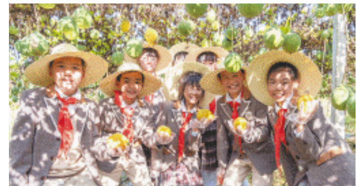
仰天湖实验学校的孩子在白箬铺镇瓜蒌基地上劳动实践课。