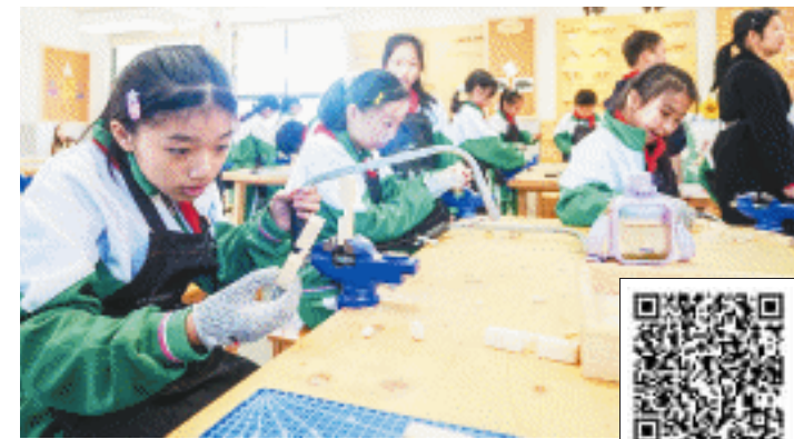
在仰天湖学校体验时，光明小学同学们“化身”小木匠，制作鲁班锁。