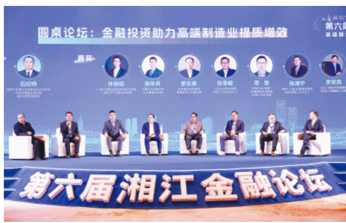
22日下午举行的高端智造创新投资发展论坛上,嘉宾们畅所欲言。