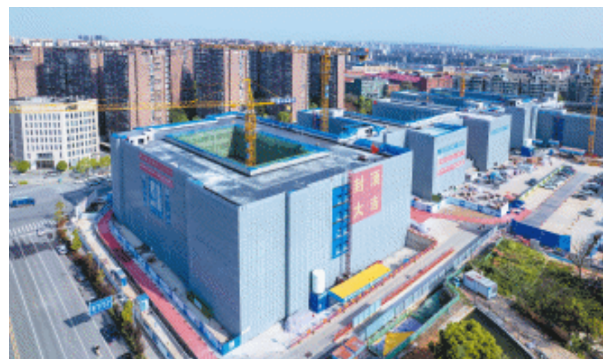
湖南建投集团中雅培粹学校新校区建设项目是行业首个采用智能建造全链指挥系统的项目，成为长沙市建筑业全流程数字化、智能化典型项目。