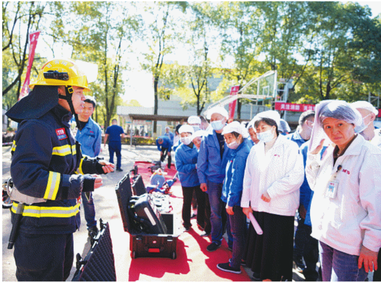
↑在长沙的园区企业,员工参观消防救援装备,消防员认真讲解。

记者从市安委办获悉,老旧居民住宅小区、出租屋、出租房屋、机关事业单位、建筑工地、人员密集场所、养老机构、福利机构、医疗机构、教育培训机构、仓储物流快速点、“多合一”场所、“九小场所”、劳动密集型企业等都是火灾事故易发多发场所,需要各级各部门和各单位重点监管监控;冬春季烤火取暖、燃气液化气安装使用、熏烤腊肉、燃放烟花爆竹等行为带来的安全风险均需特别关注、加强防范。