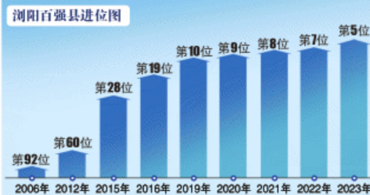
制图/王斌

浏阳，是一座来了就不想走的城市。在这里，创新活力全面焕发，创业潜力深度激发，创造动力竞相迸发。