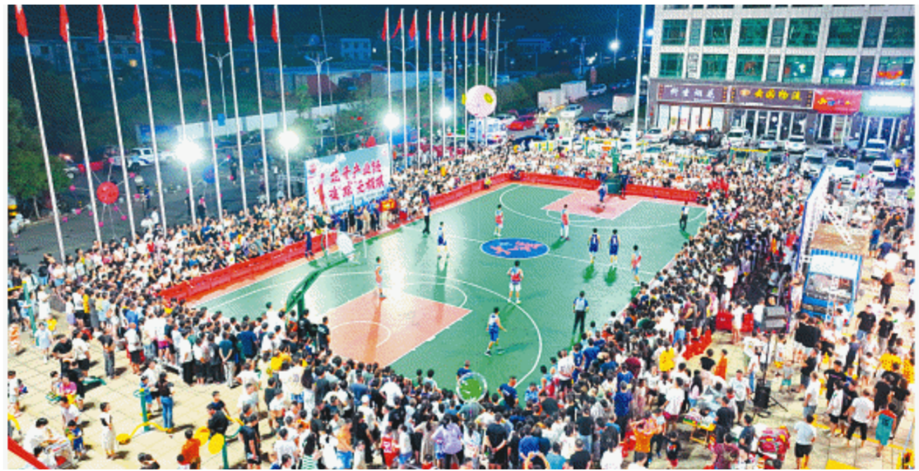
今年7月以来，浏阳市首届“全BA”篮球赛开打，营造了“全民追球”的浓厚氛围。