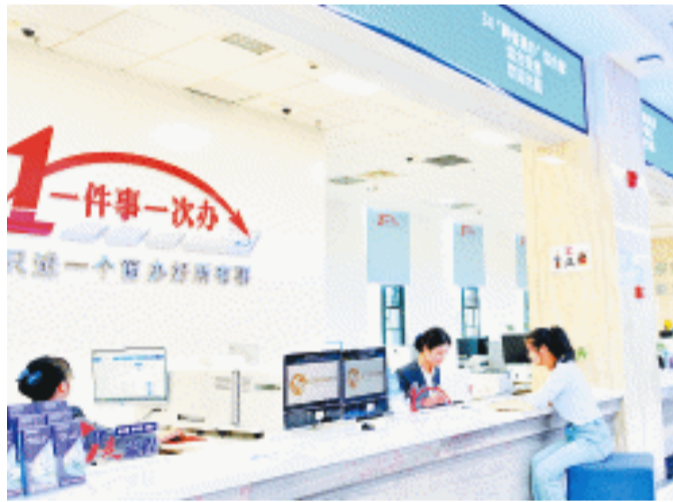
2022年，浏阳启动智慧政务建设，实现“一个窗口办所有事”，打造近悦远来的营商环境。