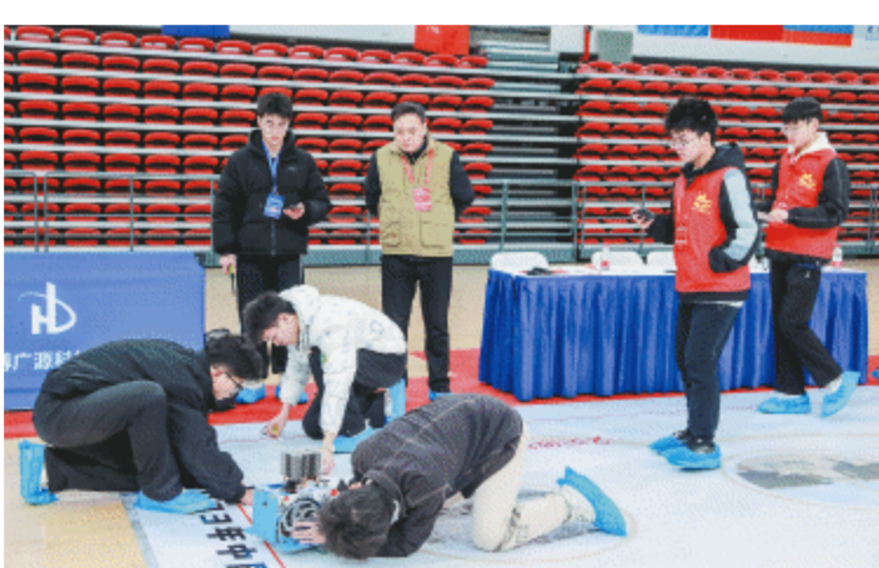
2023年中国大学生工程实践与创新能力大赛国赛(中南大学赛场)上,参赛选手现场调试、现场运行、现场展示,涌现出许多优秀的作品、亮眼的设计。

“本届大赛的最大亮点是紧密围绕培育新质生产力,突出强化大学生工程创新能力,注重理论实践结合、学科专业交叉、校企协同创新、理工人文融通。”中国大学生工程实践与创新能力大赛组委会副主任、教育部工程训练教学指导委员会副主任、竞赛工作组组长、清华大学李双寿教授介绍,大赛是深化新工科建设、推进工程教育改革的重要载体,是构建面向工程实际、服务社会需求、校企协同创新的实践育人平台,旨在培育一大批重基础、敢创新、强实践、有担当的实干青年。