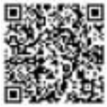
扫描二维码 看相关视频 剪辑/董阳

伤者意识更为清醒时,说出了家人的联系方式。段蛟翼帮助联系上其家属,告知其大致情况及所在医院后,才放心归队。