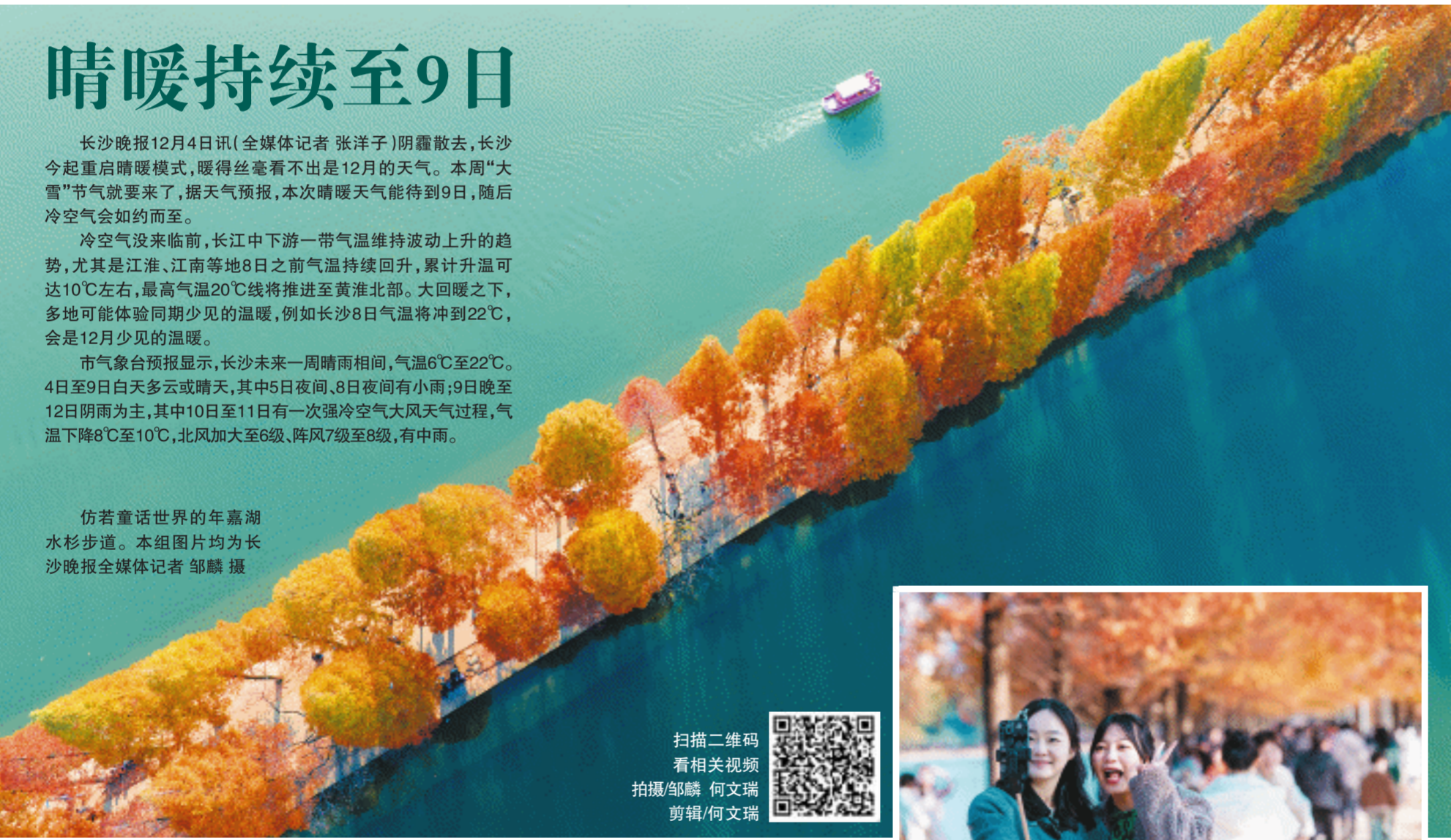
扫描二维码 看相关视频 拍摄/邹麟 何文瑞 剪辑/何文瑞