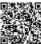
扫描二维码 看相关视频 剪辑/董阳