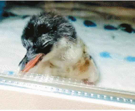
企鹅宝宝状态良好。