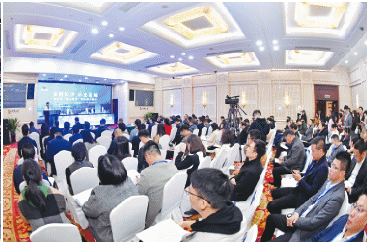
12月6日，长沙市“云上看房”博览会开幕式举行，长沙房地产云展馆平台——“云上看房”数字展馆正式上线。长沙晚报全媒体记者 王志伟 摄