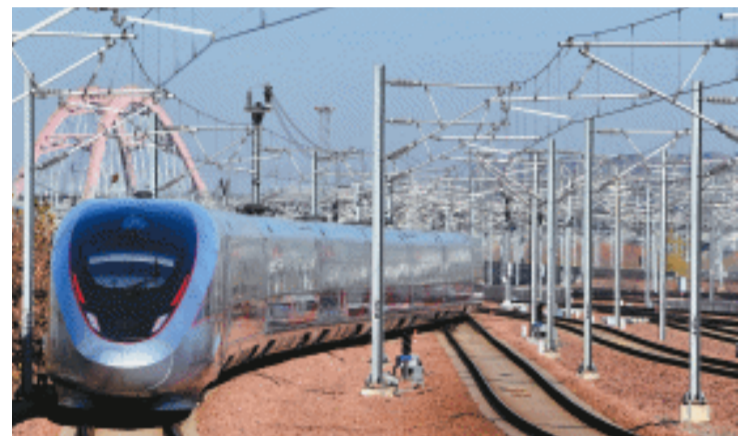
12月8日，济郑高铁郑州东站首发G4830次列车驶出郑州东站。

新华社济南12月8日电（记者张仁仁 翟濯）8日上午，济南至郑州高速铁路全线开通仪式在济南长清站、青岛北站和郑州东站、濮阳东站同时举行，济郑高铁全线贯通运营。济郑高铁起自济南西站，途经山东省济南市、聊城市、河南省濮阳市、安阳市、新乡市、郑州市，接入郑州东站，线路全长407公里，设计时速350公里。济郑高铁是国家“八纵八横”高铁网的重要连接线，是山东省“八纵六横”高铁网的西向出省通道，也是河南“米”字形高铁网的最后一“笔”。项目通车结束了聊城市不通高铁的历史，鲁豫两省实现高铁直通，郑州东站至济南西站间最快1小时43分钟可达。