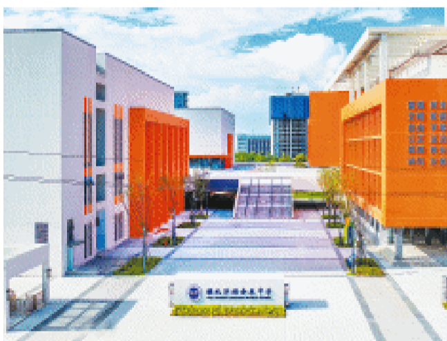
雅礼洋湖会展中学今年秋季迎来首批学生。该校为长沙县政府与雅礼洋湖实验中学合作办学的学校。