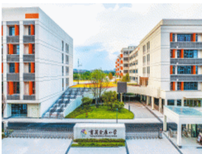
今年秋季,育英会展小学建成投用,办学规模48个班,可提供2160个学位。均为受访者供图