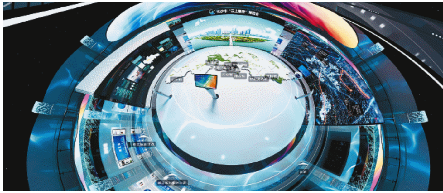
长沙市“云上看房”数字展馆小行星视角截图。