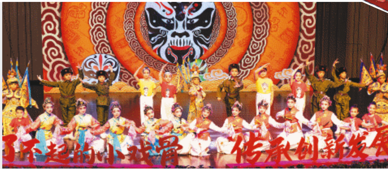
12月17日,2023年长沙市戏曲进校园集中展演暨闭幕式举行。

据了解,为了让新时代青少年更好地学习、运用、传播中华优秀传统文化,2023年长沙市戏曲进校园活动精心设计了多种戏曲“打开方