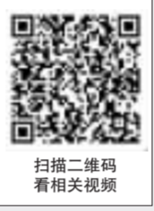
扫描二维码看相关视频

近年来,长沙在电影事业上持续发力,《长沙夜生活》联动城市文旅,实现了“电影+城市”的双向奔赴。《学爸》的热映也擦亮了“电影湘军”的金字招牌,为长沙持续引流。长沙还制定了《长沙市电影拍摄服务暂行办法》,吸引更多优秀电影来长沙拍摄。《正正的世界》《南方,南方》等作品获得全国乃至国际大奖,长沙出品、长沙拍摄电影持续闪耀大银幕。