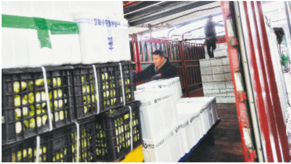
长沙海吉星日均蔬菜交易量超万吨,价格平稳,种类丰富。

萝卜、白菜、儿菜、莴笋等正大量上市,以一年中最佳的口感和颜值走向人们的餐桌。常规商品菜辣椒、土豆、芋头、菌类、本地和外地叶类菜等品种齐全,应有尽有,让市民的餐桌更加丰富多彩。在市场充足的供应下,菜价稳定。