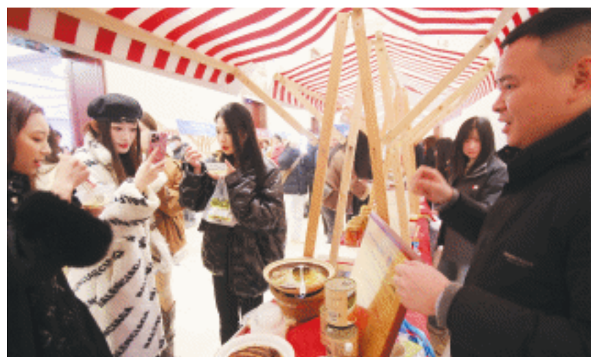
市民在活动现场品尝预制菜,兴趣盎然。

未来”2023年度长沙首届预制菜行业品牌榜发布活动,评选出2023年度长沙预制菜行业“十大领军品牌”“十大卓越人物”“爆品TOP20强”“最具竞争力产业园区(基地)”。