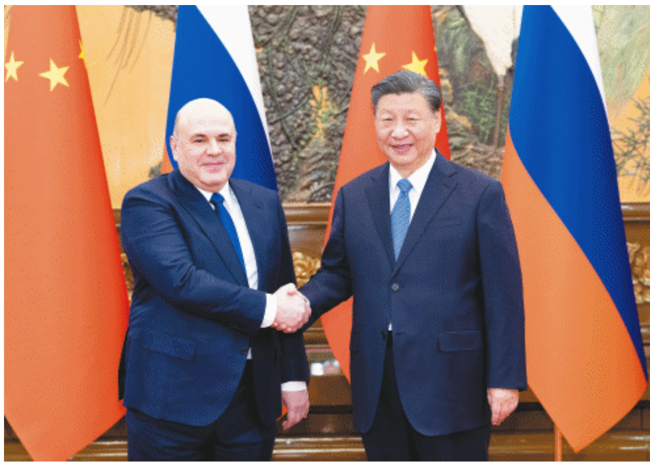
12月20日上午,国家主席习近平在北京人民大会堂会见俄罗斯总理米舒斯京。