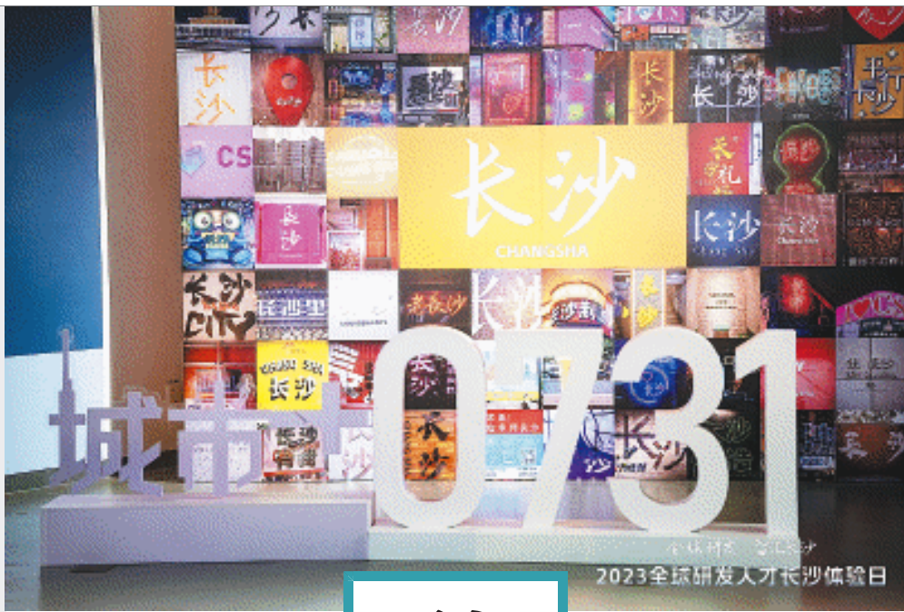
2023全球研发人才长沙体验日