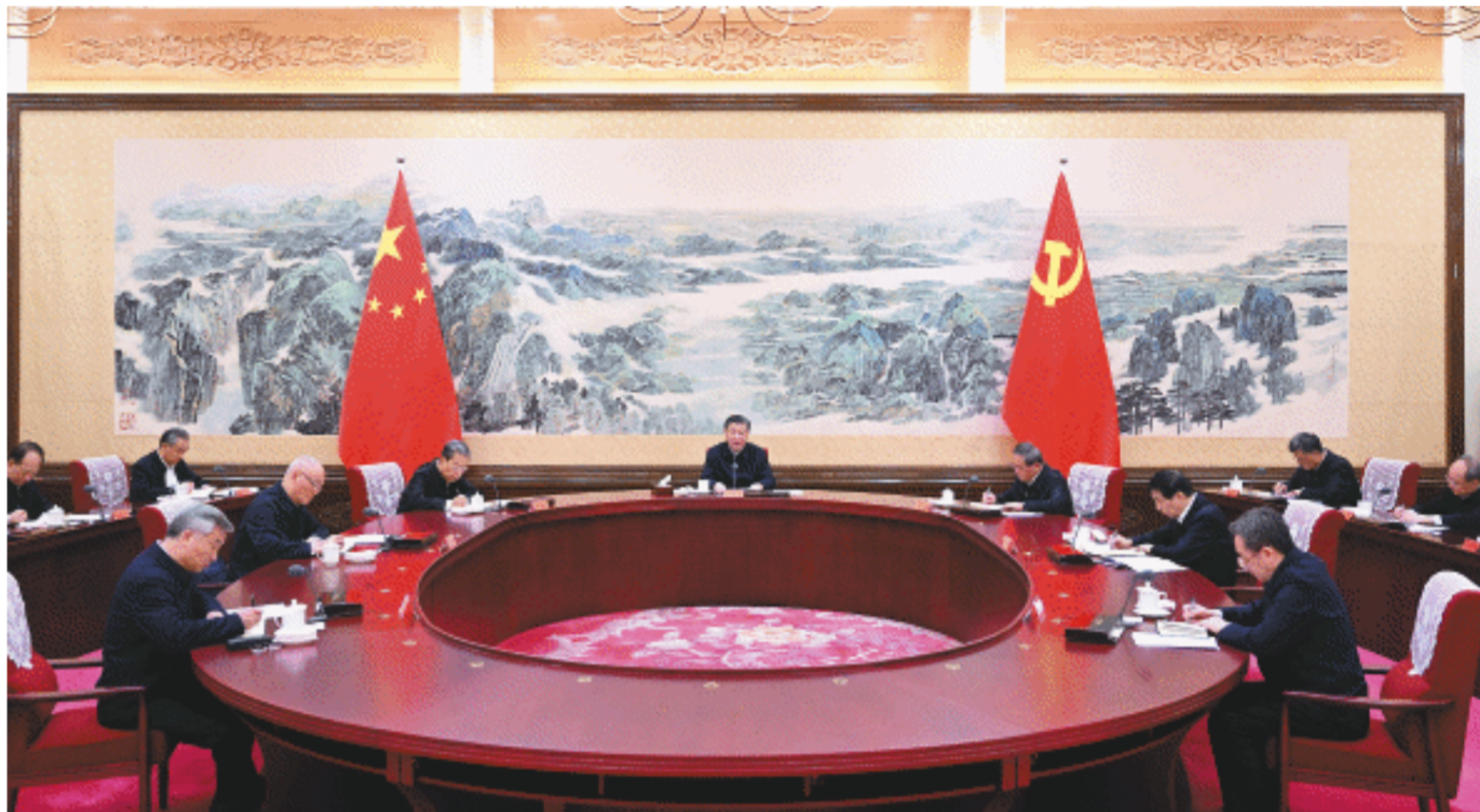
12月21日至22日，中共中央政治局召开学习贯彻习近平新时代中国特色社会主义思想主题教育专题民主生活会，中共中央总书记习近平主持会议并发表重要讲话。

●领导干部要牢固树立造福人民的政绩观。我们共产党人干事业、创政绩，为的是造福人民，不是为了个人升迁得失。高质量发展是全面建设社会主义现代化国家的首要任务，坚持高质量发展要成为领导干部政绩观的重要内容。 ●党的最大政治优势是密切联系群众，党执政后的最大危险是脱离群众，要始终把人民放在心中最高位置，站稳人民立场，厚植为民情怀，把握新形势下群众工作的特点和规律，带头走好群众路线，把心系群众、情系百姓体现到履职尽责全过程各方面，着力保障和改善民生，及时回应人民群众合理诉求，切实把好事办好、实事办实、难事办妥。