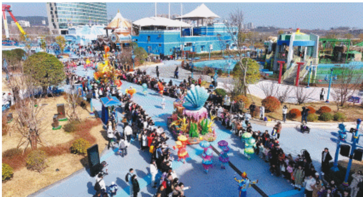
湘江欢乐海洋公园12月24日试营业,首日客流量超万人。