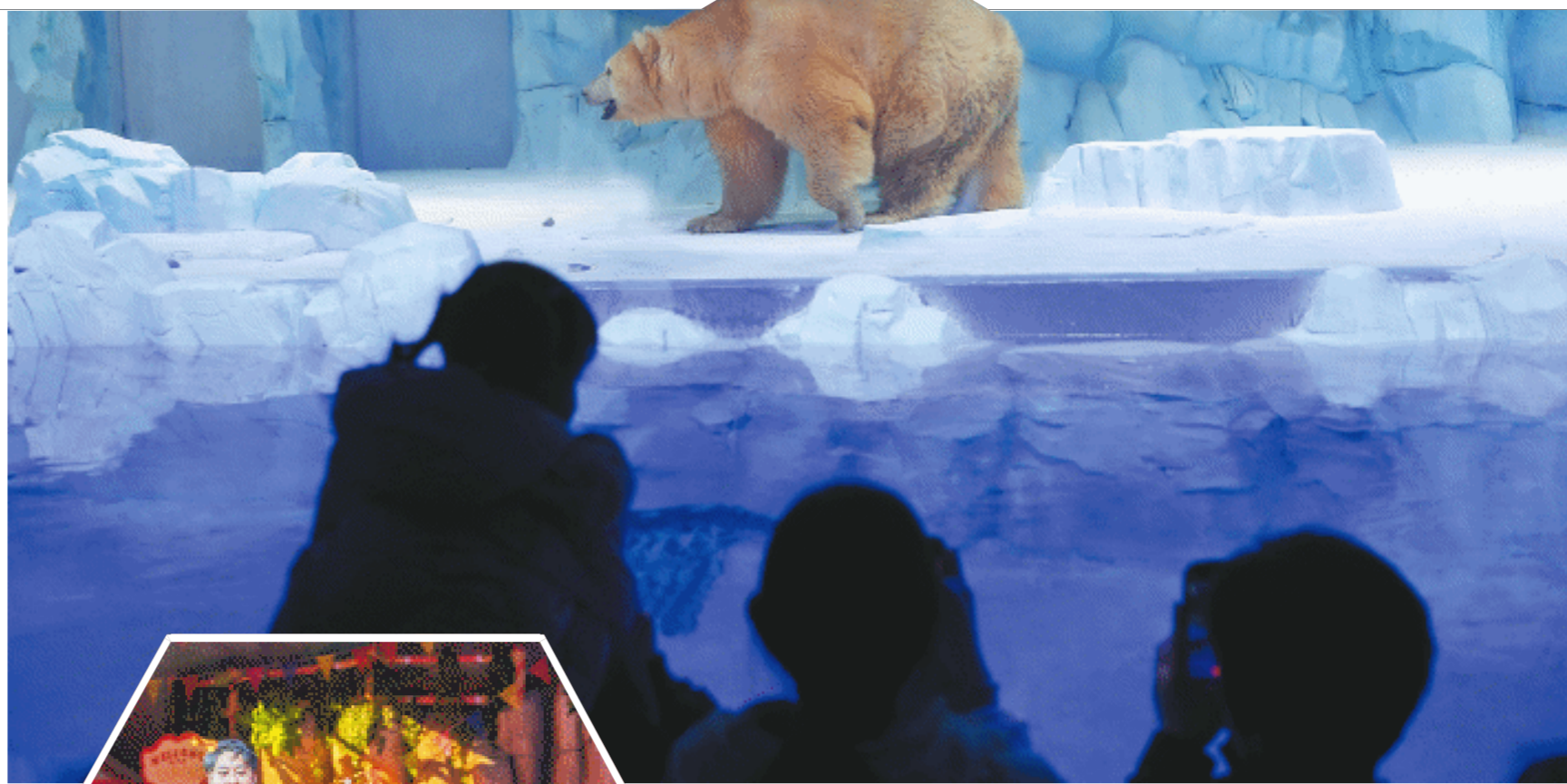
↑“极地霸主”北极熊吸引了众多游客。