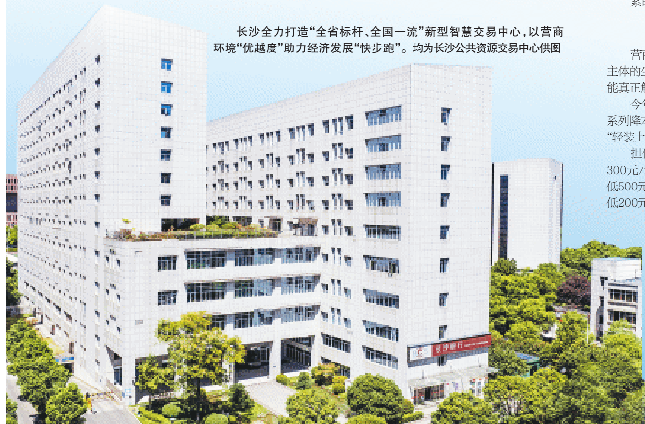
长沙全力打造“全省标杆、全国一流”新型智慧交易中心，以营商环境“优越度”助力经济发展“快步跑”。

“营”在当下，方能赢未来。下一步，长沙公共资源交易中心以精准化实现“便利化”，以“智能化”实现“透明化”，以“网络化”实现“高效化”，用一系列“良心、用心、暖心”的服务举措把企业请进来、让市场活起来、使资源跑起来，用惠企益商的服务为长沙加速进入发展“快车道”提供最优质的“软环境”。