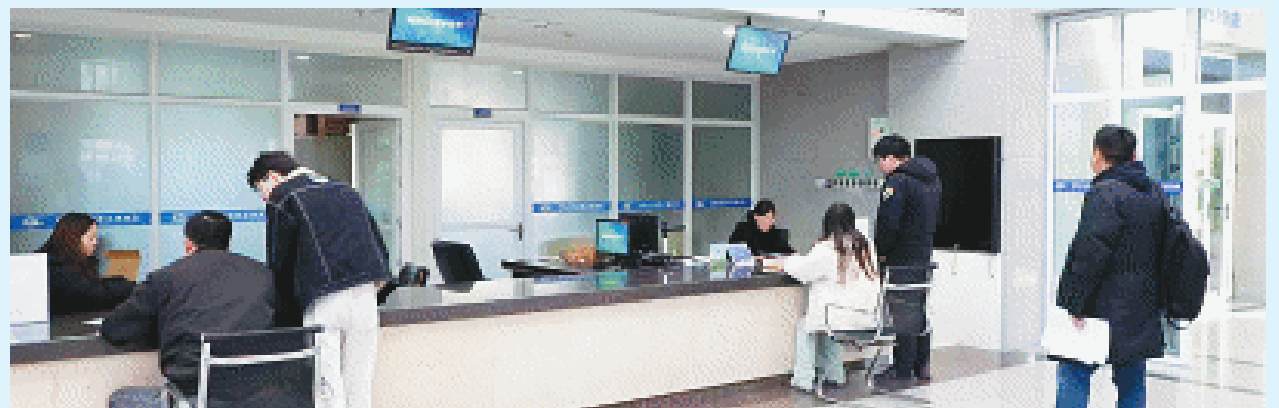
长沙公共资源交易中心开展“我为市场主体走流程”活动，将服务“难点”“痛点”变为“亮点”“风景”。

改革，让长沙公共资源交易服务以优解忧，持续打造便民服务的“金品牌”，赢得企业交口称誉的“金口碑”，擦亮营商环境的“金名片”，全力打造“全省标杆、全国一流”新型智慧交易中心，以营商环境“优越度”助力长沙建设全球研发中心城市“快步跑”。近日，长沙公共资源交易中心在2023年公共资源交易可持续发展论坛暨公共资源交易年会（第十届）获评2023年度全国十佳公共资源交易中心（市级）。