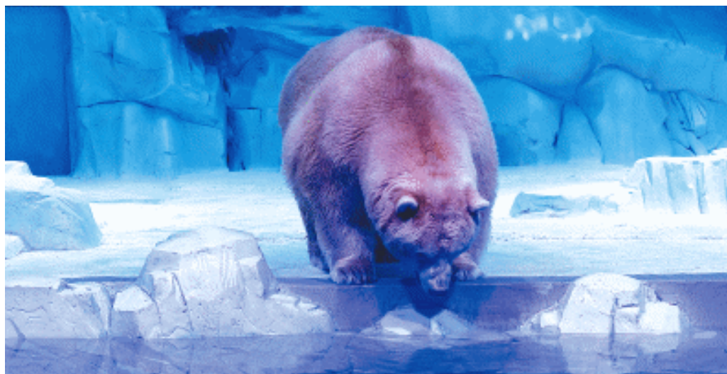
北极熊憨态可掬。

长沙晚报12月26日讯(全媒体记者 胡兆红 通讯员 周佳)去大王山看北极熊、帝企鹅吧!26日,湘江欢乐海洋公园正式开园,市民游客翘首以盼的综合性大型海洋主题乐园正式开门迎客。