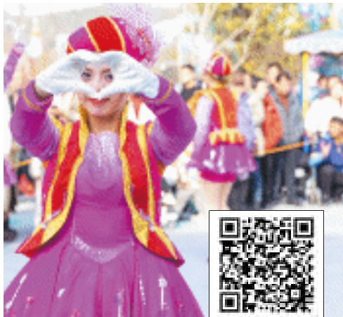
湘江欢乐海洋公园正式开园,演出人员欢迎游客来打卡。

湘江欢乐城目前已拥有欢乐水寨、欢乐雪域等设施,湘江欢乐海洋公园紧邻两大园区,搭乘大王山云巴可轻松穿行其间。无论是亲子出游,还是全家出行,都可来湘江欢乐海洋公园,开启一场充满梦幻色彩的微度假体验。