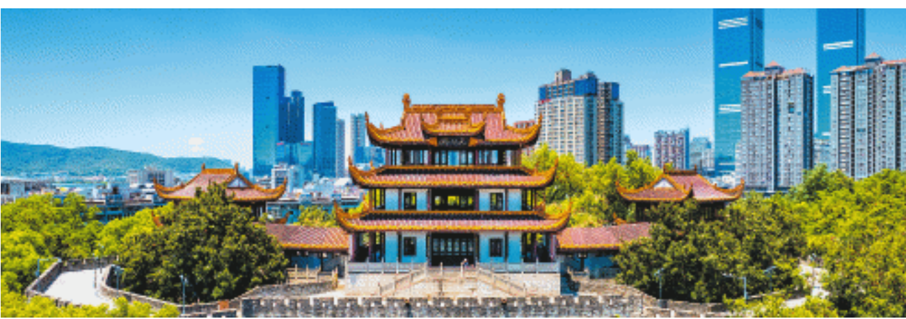
天心阁周边,群楼并起。