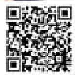
扫码看辣视频 拍摄/董阳 剪辑/柳静芸