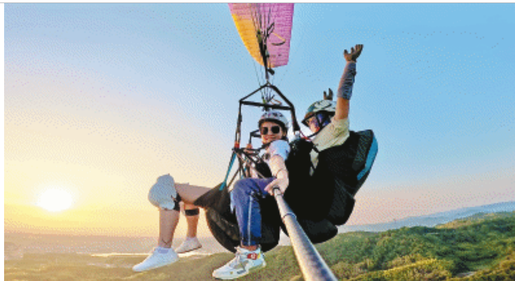
游客在滑翔伞上自拍，同时也乐享灰汤的美丽山水。

两人一拍即合，各方优势也颇为互补，经过一段时间的启动运营，陆续投入400多万元资金，正当滑翔伞基地意欲大鹏展翅之时，一场持续3年的新冠疫情突如其来。