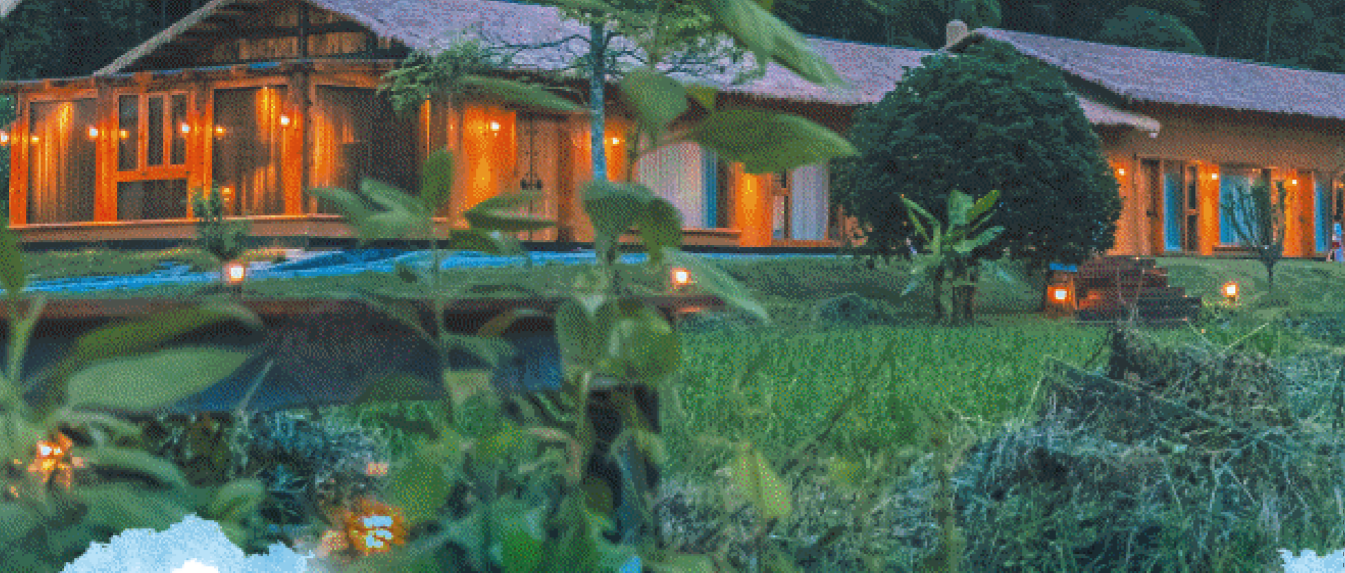
▲浏阳全力打造“三湘民宿第一高地”,五号山谷等一批精品民宿受到游客青睐。