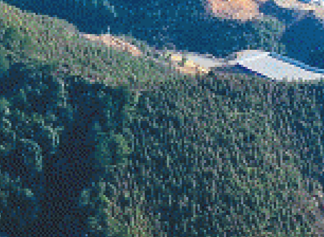
桂花水库预计2024年8月完成大坝浇筑,年底实现大坝下闸蓄水。