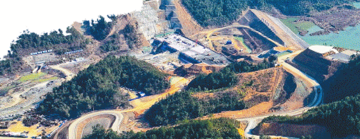
桂花水库预计2024年8月完成大坝浇筑,年底实现大坝下闸蓄水。

在浏阳北区的北盛镇,当地重点推进浏阳经开区北园片区计划产业用地工程等项目7个“清零”,腾地2000余