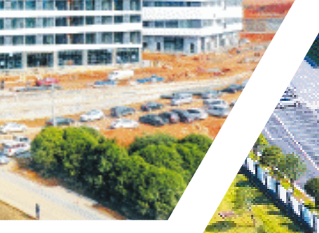
泽晋碳化硅纤维生产项目。