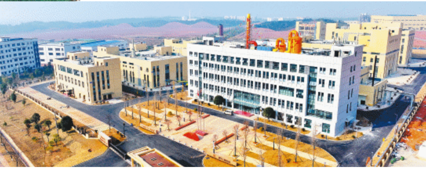
▲浏阳全力打造“三湘民宿第一高地”,五号山谷等一批精品民宿受到游客青睐。