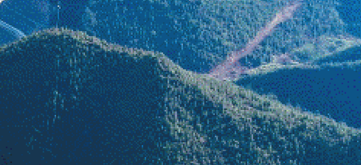
桂花水库预计2024年8月完成大坝浇筑,年底实现大坝下闸蓄水。