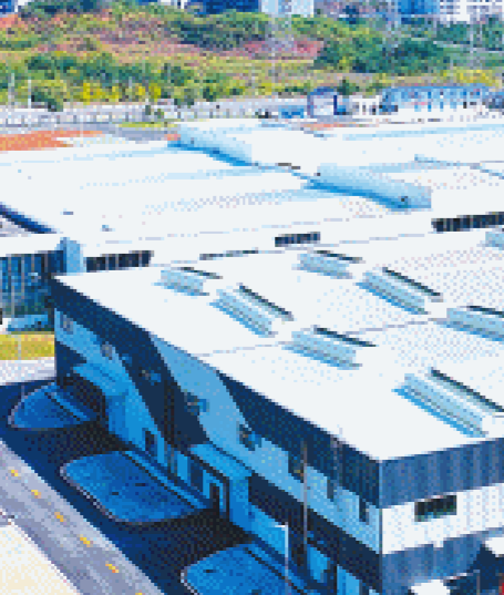
桂花水库预计2024年8月完成大坝浇筑,年底实现大坝下闸蓄水。

在浏阳北区的北盛镇,当地重点推进浏阳经开区北园片区计划产业用地工程等项目7个“清零”,腾地2000余