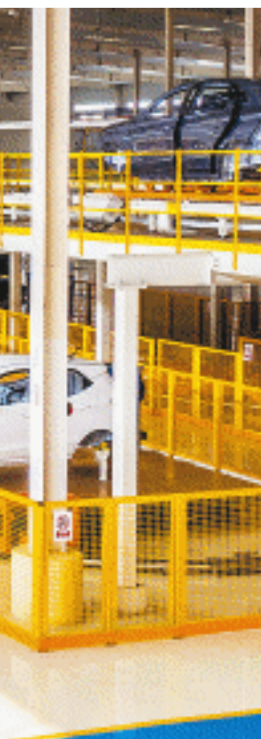
2023年，雨花区创新推出“三长制”工作机制，统筹推进好经济增长主导链，由县领导任总指挥，分别担任10个重点区域、10条细分产业链、10幢特色楼宇的“指挥长”“产业链长”“楼宇长”。

开放提速、品质提升、民生提档，雨花区抓大项目、大抓项目，以高质量项目管理赋能产业提质、