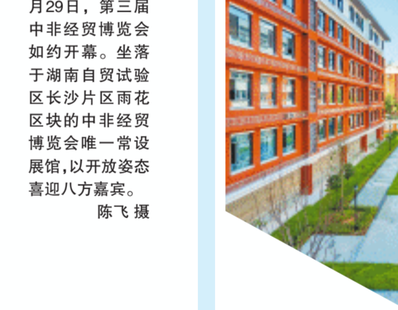
↑2023年，雨花区新(改扩)建中小学、公办幼儿园18所，新增学(园)位1.3万个。