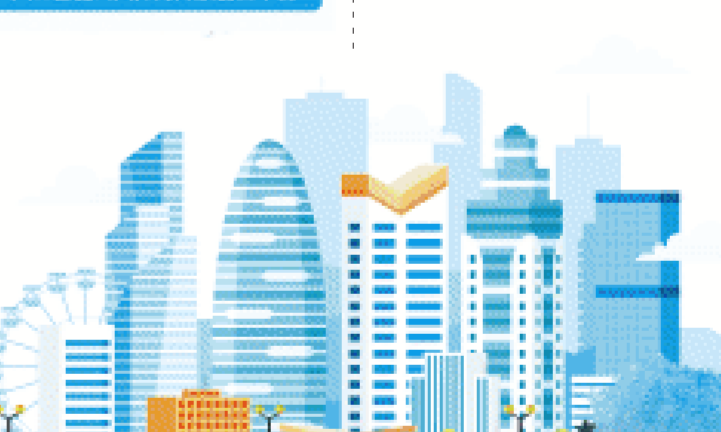
数据来源:湘江融媒