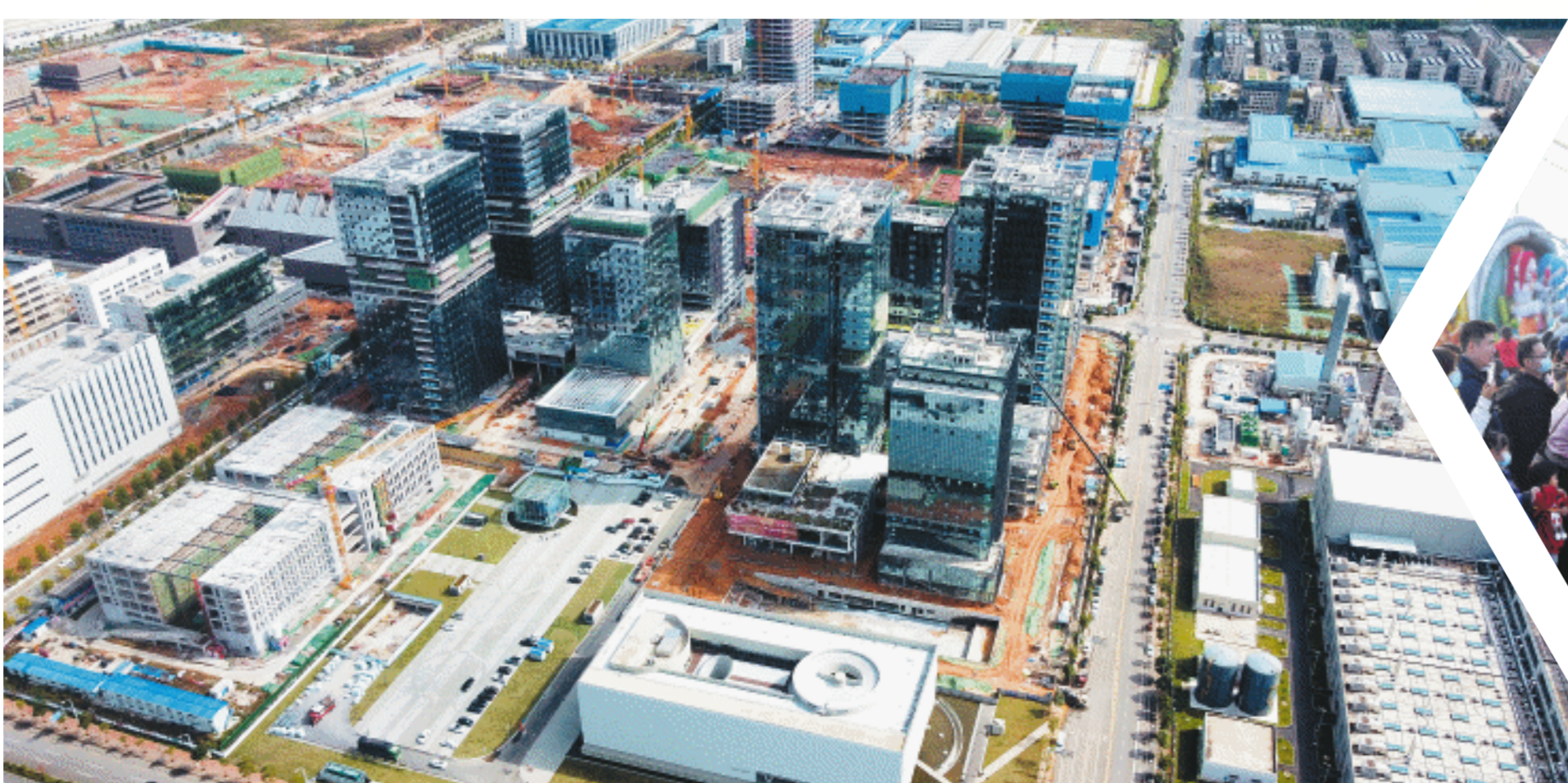
世界计算·长沙智谷将打造“产城融合、宜居宜业”的产业新城。