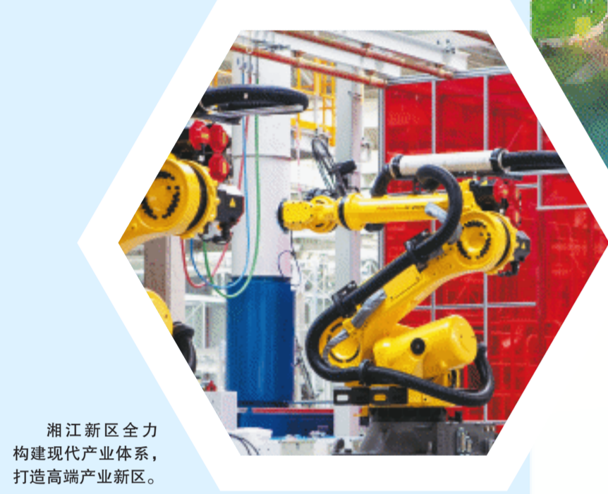
湘江新区全力构建现代产业体系,打造高端产业新区。

先进制造勇攀高峰,工程机械产业集群、新一代自主安全计算系统集群、下一代信息网络创新型产业集群成为“国字号”产业集群;科技创新激情澎湃,湘江科学城首开区正式开建,全省“四大实验室”布局,全球研发中心城市核心引领区加速建设……湖南湘江新区党工委(扩大)会议暨岳麓区委六届五次全体会议提出,要全面落实“三高四新”美好蓝图,认真践行八个“走在前、作示范”和七个“坚定不移”要求,全力推动湖南湘江新区(岳麓区)高质量发展。