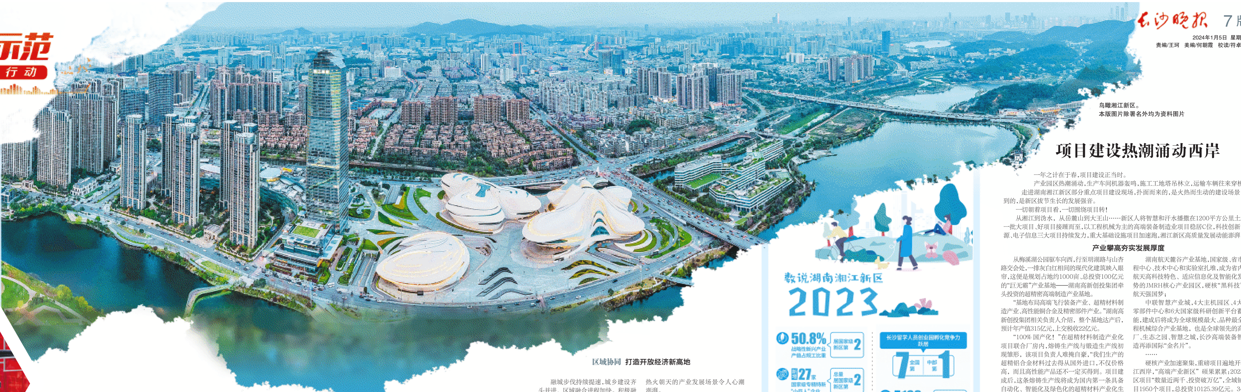
鸟瞰湘江新区。