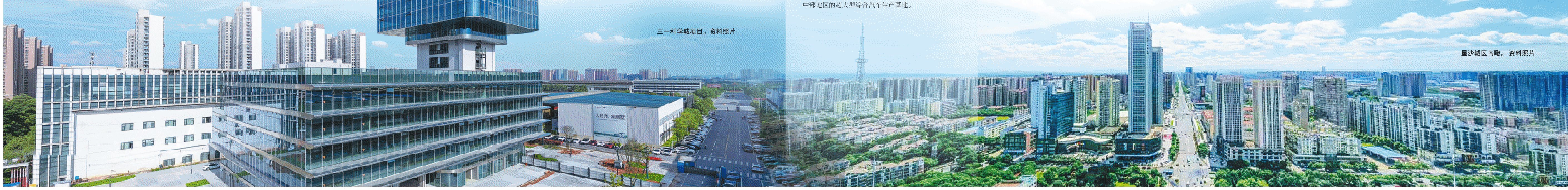
星沙城区鸟瞰。资料照片

“深化”项目建设提速年“行动，科学谋划项目，加速推进项目，精细服务项目，以项目建设的“进”，支撑经济发展之“稳”。“付旭明表示，2024年，县区将以党的二十大精神为指引，锚定“三高四新”美好蓝图，真抓实干八个“走在前、作示范”和七个“坚定不移”“当好全市高质量发展排头兵”要求，全力以赴抓项目、扩投资、促消费、稳增长，率先打造“三个高地”，全面建设中国式现代化先行区，在建设社会主义现代化新长沙新征程上谱写星沙高质量发展的壮美华章！