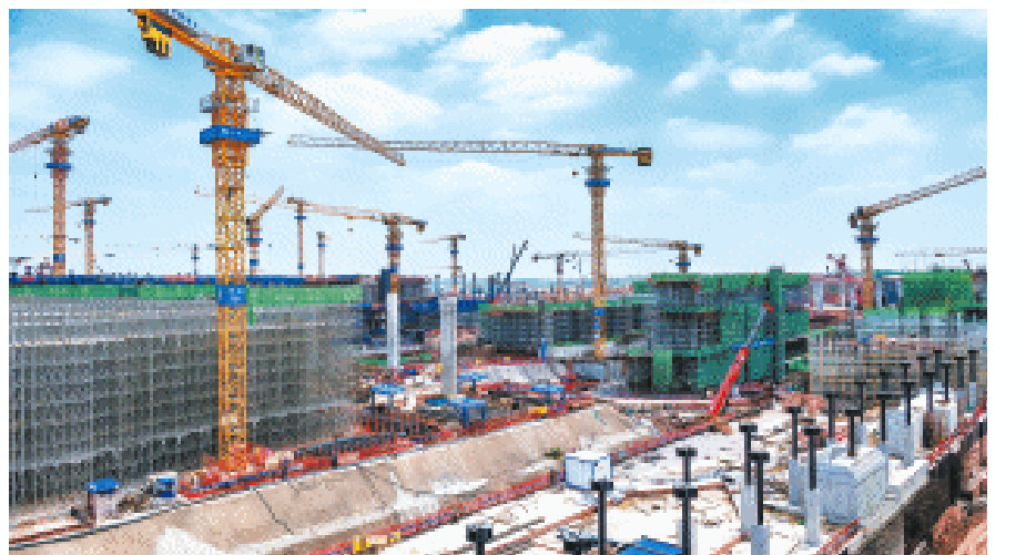
长沙机场改扩建工程。资料照片