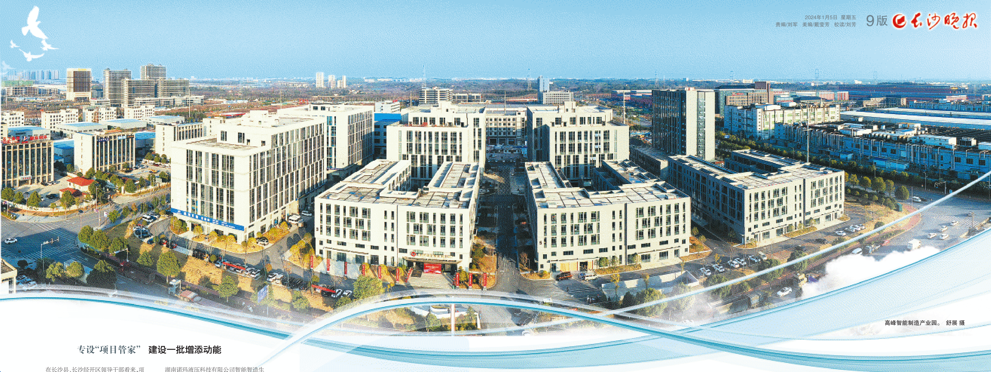
高能智能制造产业园。