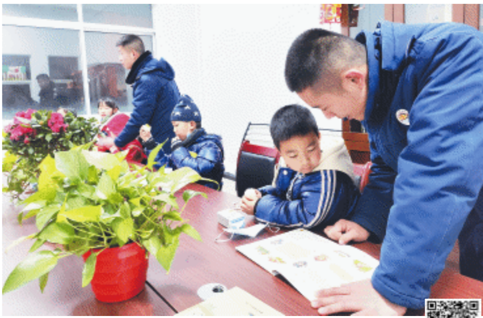
1月17日清晨，书堂山消防救援站“候车室”内，消防员为孩子们辅导功课。