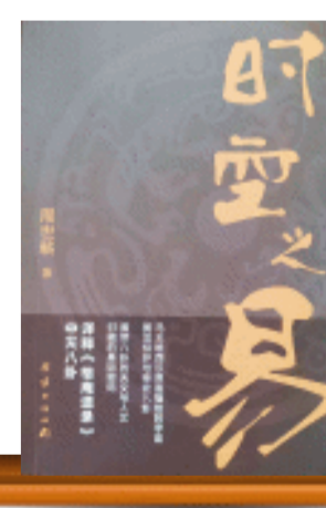
《时空之易》/周世蕻著/团结出版社/2023年8月

《时空之易》在解读西汉帛画《太一出行图》中,将题记“黄龙持鼙”的“鼙”释为“炉”。作者通过对长沙马王堆出土西汉文献和山西襄汾县出土新石器时代文物,并用三重证据法(文献、文物和传说)说明了“炉”为土鼓乐器。鼓是打击乐器之一,在我国上古时代就被用于祭祀仪式、舞蹈和军事活动中。传说《扶犁》是神农氏的乐舞,内容是歌颂神农氏发明农具、教民农耕的伟绩。在神农时期人们的心宿(商星)的祭祀舞乐中,就使用了土鼓。《时空之易》对钟的起源,给出了一个神话传说版本。作者在解释西汉帛画《太一出行图》“青龙奉容”题记时,将“容”释