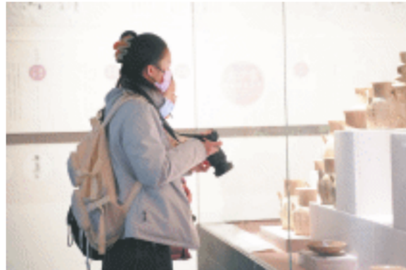
游客在观赏含有龙元素的文物。