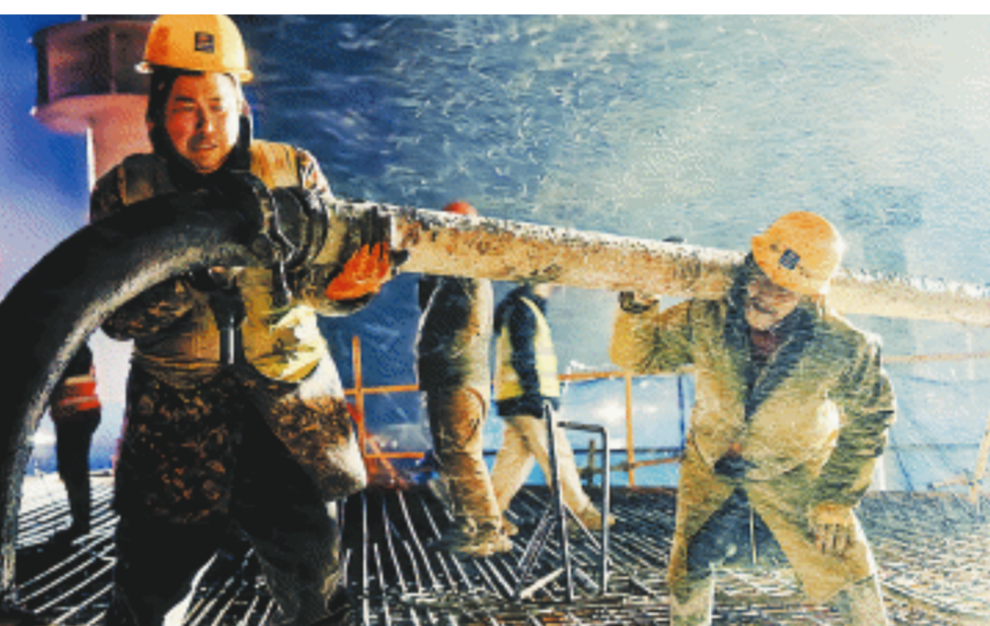
6日，T3航站楼候机大厅北区封顶，工人正在进行泵管拼装。