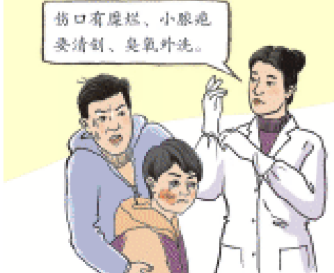
伤口有糜烂、小脓疱,要清创、臭氧外洗。

一瞬间,乐乐的面部被炸出了一个拇指大小的开放性伤口,回到家不久,他的半边脸变得又红又肿。乐乐父亲没有犹豫,赶紧将孩子送到湖南省儿童医院急诊外科救治。急诊外科医生第一时间为乐乐注射了破伤风及清创处理,并用纱布进行面部保护。