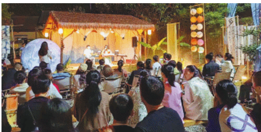
中秋雅集。均为资料图片

文艺的身影活跃在楚尧大地。围绕工业建设，宁乡文联组织编写两卷本《宁乡百企赋》，分为经开区卷、高新区卷，翔实展示宁乡工业成果和工业发展面貌，组织“高新园区杯”全国性工业题材摄影大赛，组织“忘不了”全国三行诗大赛，组织“文艺名家看宁乡”园区采风活动；围绕城市建设，组织编写《蝶变》；围绕丰富城市文化生活，组织多样化的新年诗会、中秋诗会、音乐会等活动；为服务大型文旅项目资福窑开园，组织主创《资福窑》一书，编排主题歌舞《资福窑》。宁乡市文联还与宁乡市中医院达成文艺共建五年合作协议，探索“文”“医”共建新模式。