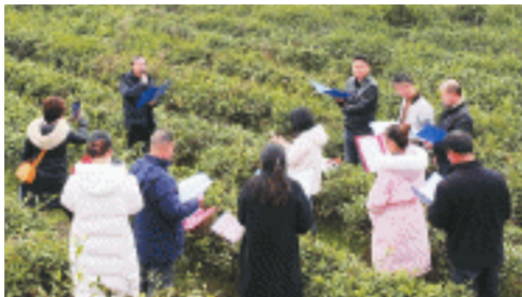
沩水源农民诗社社员在茶山上吟诵。