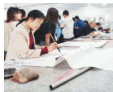
位于坝塘的农民画室。

电影《何叔衡》获得省“五个一”工程奖；原创花鼓大戏《永远的叔衡》获得第七届湖南艺术节田汉音乐奖、《新官上任》纳入省文旅厅支持项目；原创花鼓大戏《欧阳道》获长沙市文艺创作扶持，成功搬上舞台。宁乡书法、美术、摄影、剪纸作者的作品在国家级展览中入选。