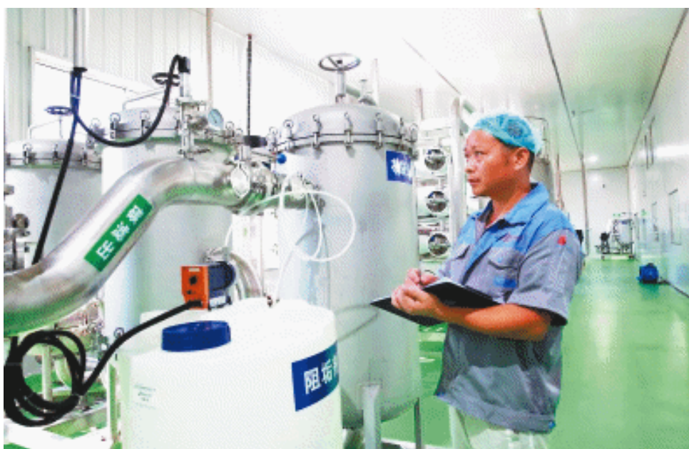
位于宁乡经开区的湖南湘娃饮料科技有限公司娃哈哈桶装水生产基地。资料图片

到2007年,有5家娃哈哈生产企业落户星沙,总投资已逾4亿元。主营饮料的长沙娃哈哈饮料有限公司,2006年税收过2000万元,成为长沙县和长沙经开区工业二十强企业。主营纯净水的长沙娃哈哈食品有限公司、主营AD钙奶的长沙娃哈哈长荣饮料有限公司2006年税收均过1000万元。这一时期,娃哈哈在长沙建成投产了饮用水、营养快线等五大系列产品,