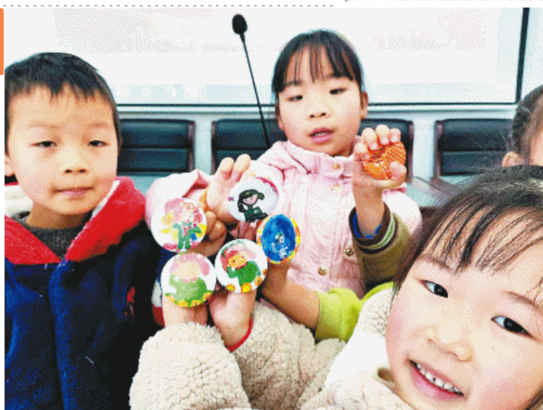
雷锋,在小朋友的心中是怎样的形象?3日,望岳街道谷峰村新时代文明实践站开展“传承雷锋精神,争做‘雷小锋’”手绘雷锋像章活动,参加活动的孩子们在听完雷锋故事后,动手将各自心中的雷锋形象画在像章上,以此追寻雷锋精神。长沙晚报全媒体记者 贺文兵 摄

“雷锋的一生,是为梦想而奋斗的一生。”杨德才鼓励孩子们,“雷锋精神人人可学,希望你们从小就在心中种下梦想的种子,从小事做起,从身边做起,在学习中刻苦努力,在社区里热爱公益,在生活中尊老爱幼,为了梦想奋力奔跑,努力成长为对社会有用的人。”杨德才的动情宣讲和感人故事深深打动了师生,现场不时响起雷鸣般的掌声。东风小学六年级学生李语晨感慨地说,在今后的学习和生活中,她将努力传承弘扬雷锋精神,以“雷小锋”的身份示范带动更多人加入志愿服务队伍中。