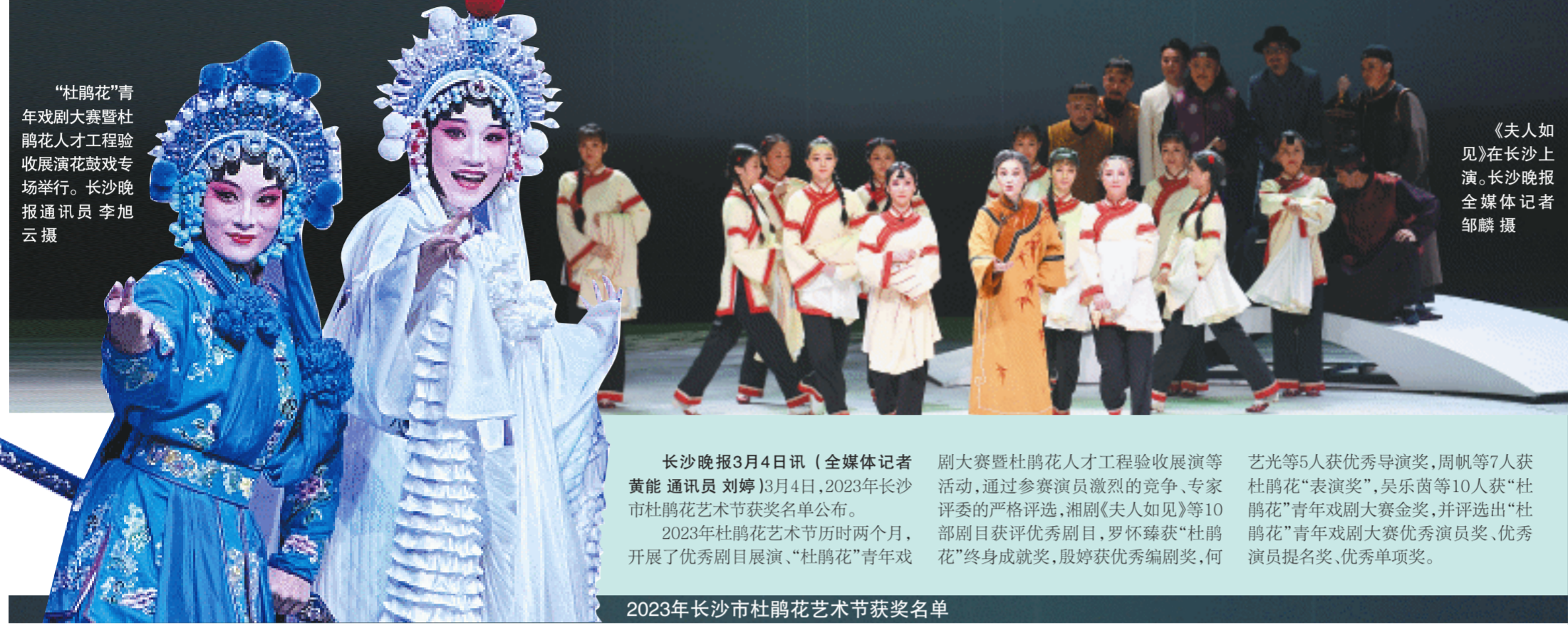
《夫人如见》在长沙上演。

长沙晚报3月4日讯(全媒体记者 黄能 通讯员 刘婷)3月4日,2023年长沙市杜鹃花艺术节获奖名单公布。2023年杜鹃花艺术节历时两个月,开展了优秀剧目展演、“杜鹃花”青年戏剧大赛暨杜鹃花人才工程验收展演等活动,通过参赛选手激烈的竞争、专家评委的严格评选,湘剧《夫人如见》等10部剧目获评优秀剧目,罗怀臻获“杜鹃花”终身成就奖,殷婷获优秀编剧奖,何艺光等5人获优秀导演奖,周帆等7人获“杜鹃花”表演奖,吴乐茵等10人获“杜鹃花”青年戏剧大赛金奖,并评选出“杜鹃花”青年戏剧大赛优秀演员奖、优秀演员提名奖、优秀单项奖。