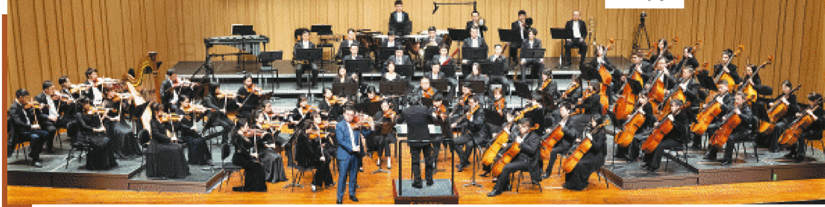
3月10日晚，“故乡情”辉煌的交响音乐会在长沙音乐厅奏响，长沙伢子、旅德中提琴演奏家梅第扬与长沙交响乐团联袂演出。